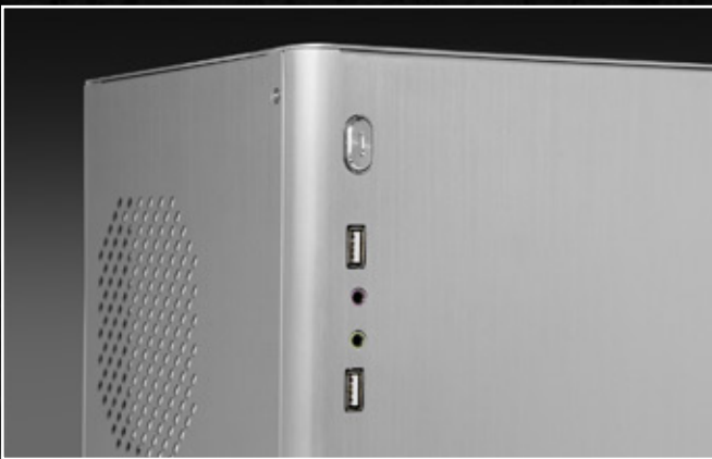
前面 I/O: USB2.0 が 2 つと オーディオポートが 2 つ