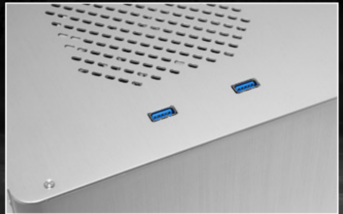
USB3.0 が 2 つ (内部 19 ピンメインボードコネクタ)